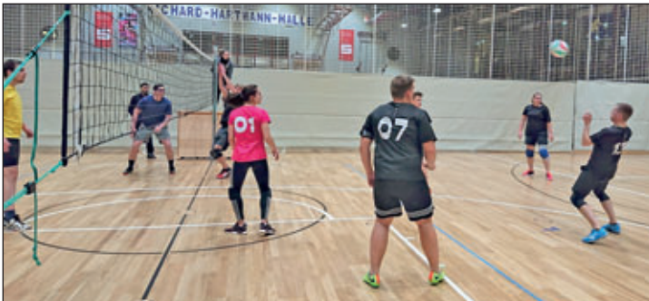
Entscheidungssatz im Finalspiel – am Ende (halb 2 Uhr nachts) ein sehr guter 2. Platz ☺

Denn ein ähnlich tolles Ereignis gab es kürzlich in sportlicher Hinsicht zu feiern. Die Teilnahme an der Sportnacht in der Hartmannhalle mit 20 jungen Menschen Ende November war Dank des großartigen Einsatzes aller Mitstreiter von enormen Erfolg gekrönt. Gegen sieben weitere Freizeitteams aus anderen Jugendclubs und -einrichtungen konnten unsere beiden den 2. und 3. Platz im Volleyball erkämpfen. Allen Beteiligten ein herzliches Dankeschön für ihr Engagement, das Anfeuern sowie die Versorgung mit leckeren Snacks!