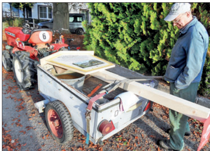
Gerd Arnold bringt alles Benötigte heran und Otto Günter Boden kontrolliert die Vollständigkeit