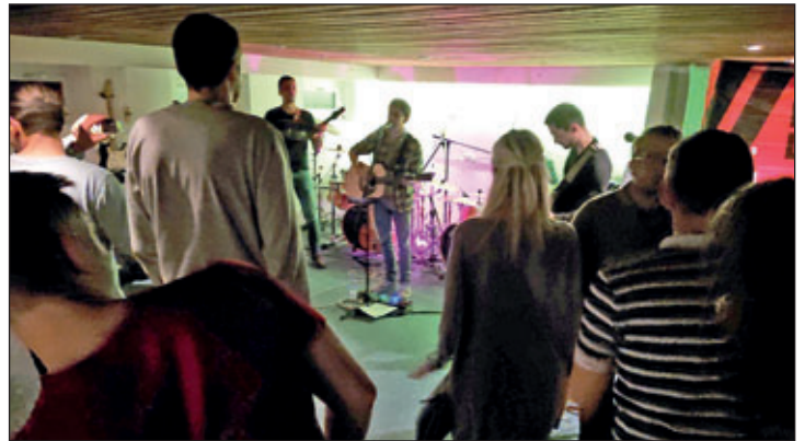
Der gut besuchte erste Auftritt von „Tanner“ bei uns im Bandkeller.

Außerdem fand im November nun endlich die erste Karaoke-Party von der Auktion beim Sommerfest im Kirchgarten statt, die seit Juli geplant wurde. Vorab gab es Blech-Pizza in gemütlicher Runde und zu späterer Stunde sogar noch einen Bandauftritt im Probenraum. Die Band „Tanner“ feierte ihr Debüt bei uns im Keller und es war – trotz erkältetem Sänger – eine gelungene Performance von Cover-Songs und eigenen Liedern. Vielleicht passt es zu einem anderen Anlass mal wieder! Wir würden uns freuen.