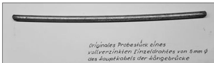
Originales Probestück eines vollverzinkten Einzeldrahtes von 5 mm \phi des Hauptkabels der Hängebrücke

Zum Bau der Hängebrücke wurden die Hauptkabel mit einem Durchmesser von 85 cm (!) von Ankerblock zu Ankerblock über die 254 m hohen Pylonen montiert. Zur Orientierung wird im Bild 1 ein originales Probestück des vollverzinkten Einzeldrahtes von 5 mm Durchmesser dargestellt. Ein Hauptkabel besteht aus 18 648 (!) Einzeldrähten. Die Spannweite von 1624 m (!) zwischen den Pylonen ist in Fachkreisen ein Rekordmaß. Die Durchfahrts Höhe für den internationalen Schiffsverkehr beträgt 65 m.