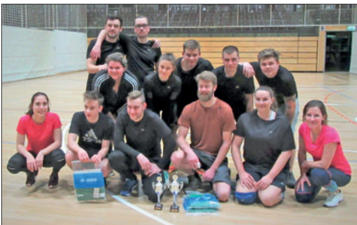
Vielen Dank für euren Einsatz, Kampf- und Teamgeist sowie euer Durchhaltevermögen! Es wurde belohnt!

Außerdem fand im November nun endlich die erste Karaoke-Party von der Auktion beim Sommerfest im Kirchgarten statt, die seit Juli geplant wurde. Vorab gab es Blech-Pizza in gemütlicher Runde und zu späterer Stunde sogar noch einen Bandauftritt im Probenraum. Die Band „Tanner“ feierte ihr Debüt bei uns im Keller und es war – trotz erkältetem Sänger – eine gelungene Performance von Cover-Songs und eigenen Liedern. Vielleicht passt es zu einem anderen Anlass mal wieder! Wir würden uns freuen.