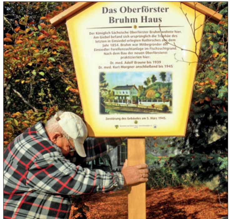
Hier ist der Standort der Aufstellung