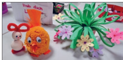
Buntes Allerlei mit Beispielen, was sich im CLUB basteln/gestalten lässt...

Am Valentinstag fand dann noch ein Kindergeburtstag mit Schnitzeljagd, Vulkan-Experiment, Dino-Ausgrabung und Hieroglyphenrätsel statt. Das alles wäre ohne die Unterstützung großartiger Menschen (Praktikant*innen, ehrenamtlich und freiwillig Helfende) nicht möglich gewesen. VIELEN DANK! Auch in der zweiten Ferienwoche gab es unter anderem mit Handlettering und Spielenachmittag ein abwechslungsreiches Angebot.