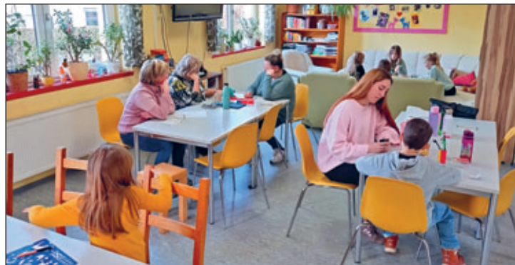
Ein Teil der Ferienkinder aus der Einsiedler Grundschule im Jugendclub am 12. Februar 2026.

Am Donnerstag waren über 40 Hortkinder der Einsiedler Grundschule im CLUB zu Besuch. Es wurde gemalt, am Dartautomaten und der t-wall (Lichtreaktionswand) gespielt, im Obergeschoss verschiedene Figuren aus Papprollen gebastelt, im Keller gab es Tischtennis, Minibillard und zum Mittag Hot Dogs. Im Garten wurde sich mit Reifen, Frisbee, Klettbällen und Kreide ausgetobt.