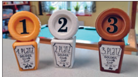
Die 3D-gedruckten Pokale für den Golden-CLUB-Cup mit 12 Teilnehmenden.

Aber auch die Winterferien waren reich mit Angeboten gefüllt: gleich zu Beginn fand der Golden-CLUB-Cup statt – ein Turnier im Obergeschoss auf der Slotracing-Autorennbahn mit Kindern und Jugendlichen unter anderem vom Jugendhaus Substanz. Umgedreht wollten wir uns dann am Mittwoch darauf mit Teilnehmenden am Tischtennisturnier der Substanz im feel good Club beteiligen, aber leider lagen bis zur Frist keine Anmeldungen vor. Schade