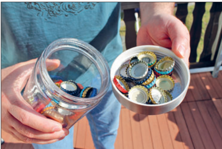
Nur 0,2 Gramm wiegt ein Kronkorken aus Weißblech – doch die Masse macht’s. Gut zwölf Tonnen brachten 2025/26 mehr als 2.000 Euro zugunsten der Deutschen Darmkrebsvorsorge.