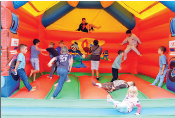
Auch zur 2026er-Kirmes wird es auf der Hüpfburg hoch hergehen.