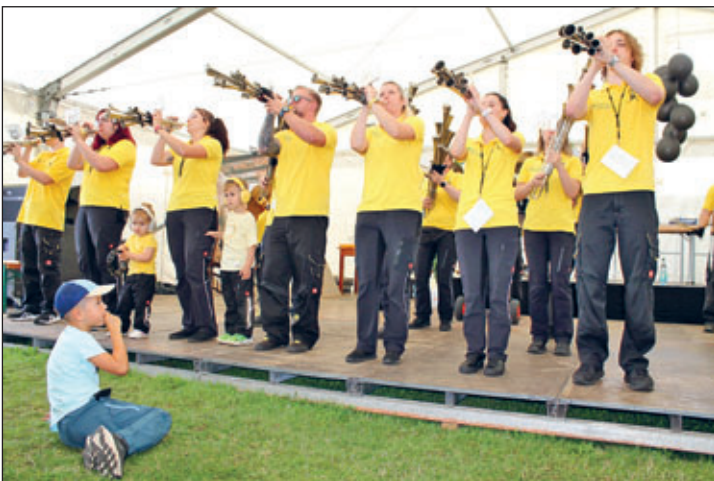
Die Schalmeienkapelle Großbolbersdorf e. V. feierte im vergangenen Jahr Kirmes-Premiere in Berbisdorf und hat sich für dieses Jahr erneut angesagt. Die Musikanten spielen zum Sonntags-Frühschoppen am 26. Juli auf.