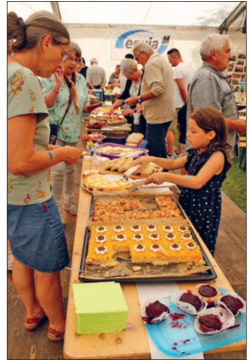
Alle Jahre wieder am Nachmittag des Kirmessonntags begeistert die hiesige Kirchgemeinde Jung und Alt mit ihrer verführerischen Kuchentafel.