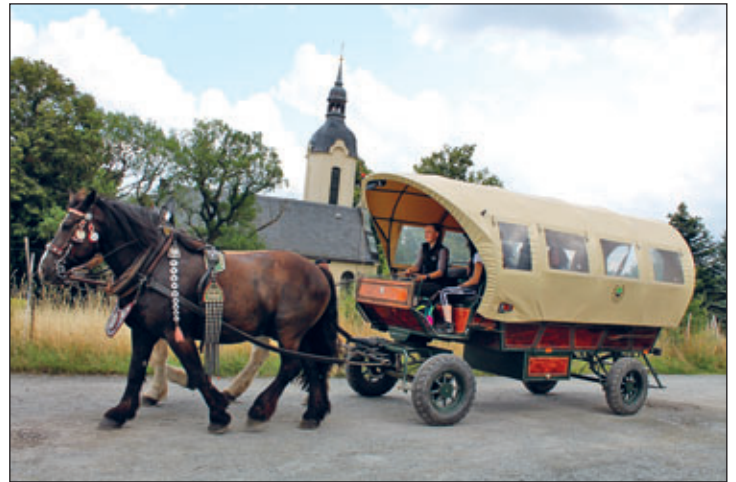
Kutschfahrten gehören traditionell zu den Attraktionen des Berbisdorfer Kirchweihfests.